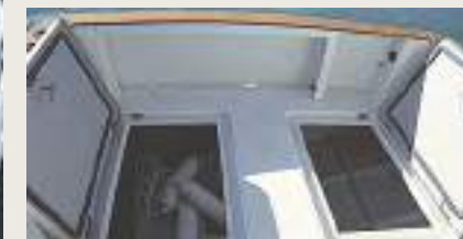
Bañera y plataforma en Teka (Opcional)