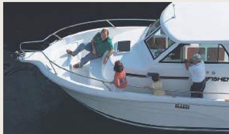
Pasillo lateral Mod. Walk Around - Side gangway on Walk Around

You may take the option of a sliding door on the starboard side for direct access from the wheelhouse into the starboard walk around, which makes a starboard docking approach easier.