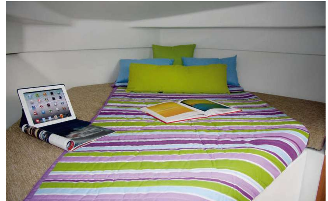
Espacioso camarote de proa con cama doble (2.00 m x 1.35 m). Roomy front cabin with large double berth (2.00 m x 1.35 m).