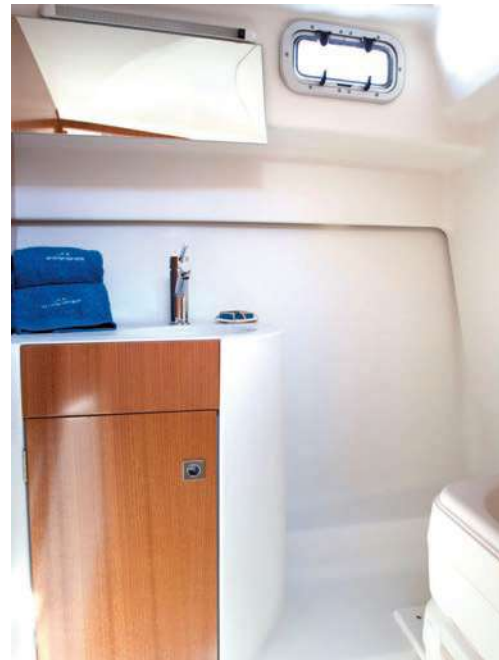
A estribor dispone de un aseo separado de 1,75 m de altura. On starboard there is a separate head 1.75 m in height.