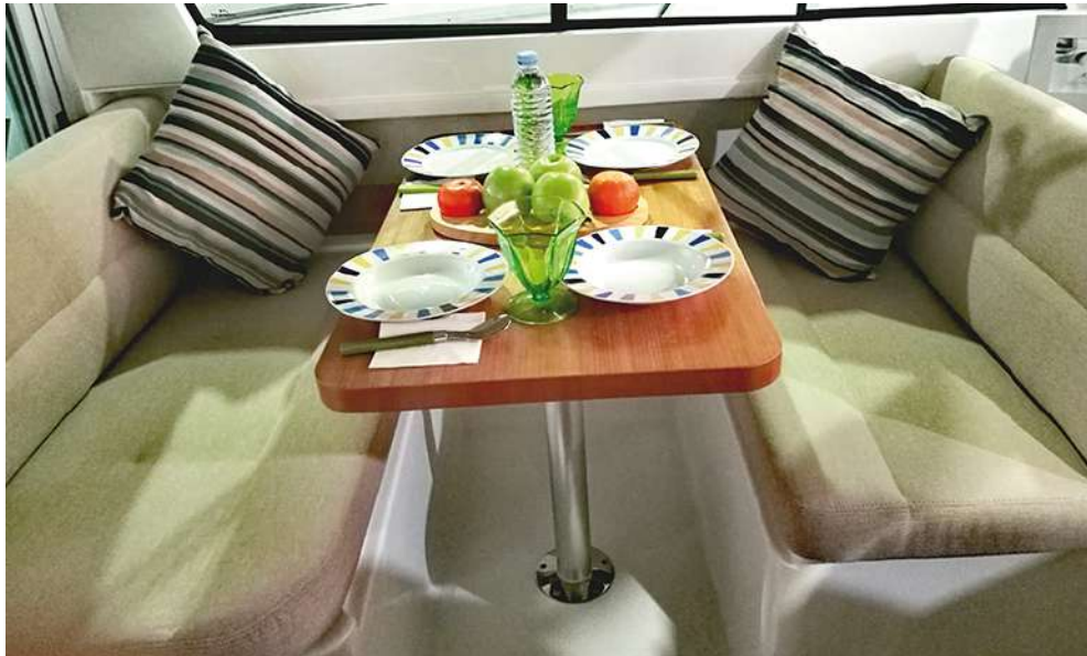
La dinette permite acomodar a 4 personas confortablemente. Sus amplias ventanas laterales (correderas) proporcionan una total ventilación. The dinette accommodates 4 people comfortably. Its extensive lateral windows provides full ventilation.