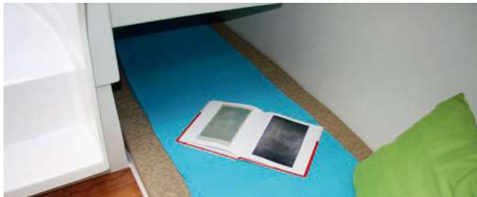
Amplia cama de babor (2,10 m x 0,85 m), ideal también como espacio de estiba. Large port-side bed (2,10 m x 0,85 m), also an ideal storage place.