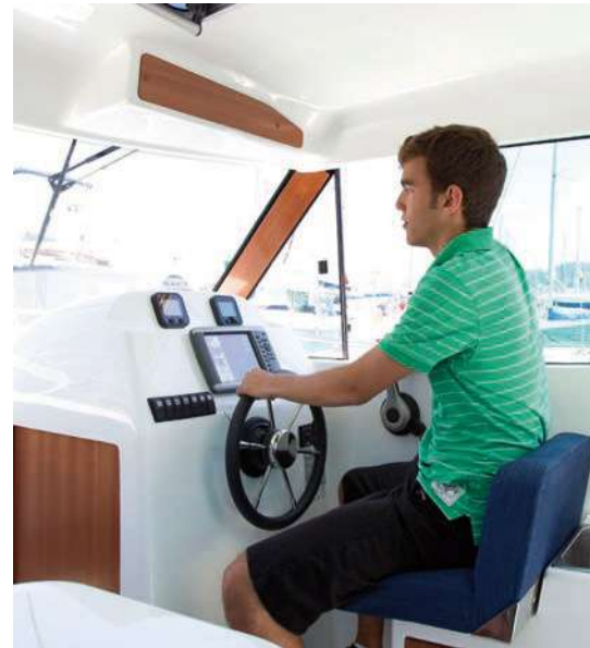
El puesto de gobierno, a estribor, dispone de un cómodo asiento de pilotaje abatible. A comfortable foldable helm seat is located on starboard.