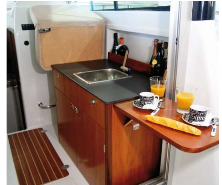
Mueble de cocina completo con fregadero profundo y mesa plegable. Fully equipped galley, with deep sink and expanding table for extra preparation space.