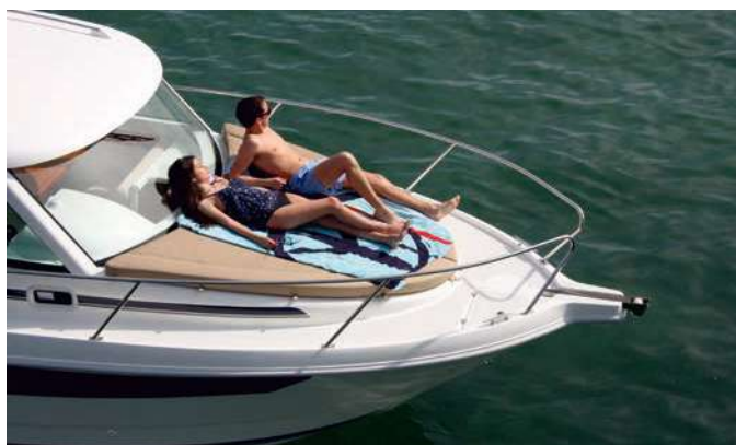
Espaciosa proa, con pozo de anclas y solarium de proa acolchado (1.80 m x 1.70 m). Spacious bow, with wide anchor locker and large mattress sunbed (1.80 m x 1.70 m).