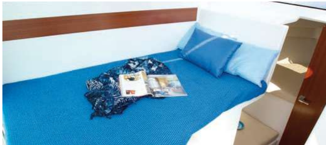
Posibilidad de pernocta de hasta 4 personas, gracias a la dinette transformable en cama. 4 sleeping places, thanks to a transformable dinette.