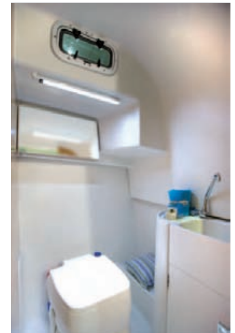
Dispone de aseo separado de 1,65 m de altura max. It has a separate toilet of 1.65 m max. height.