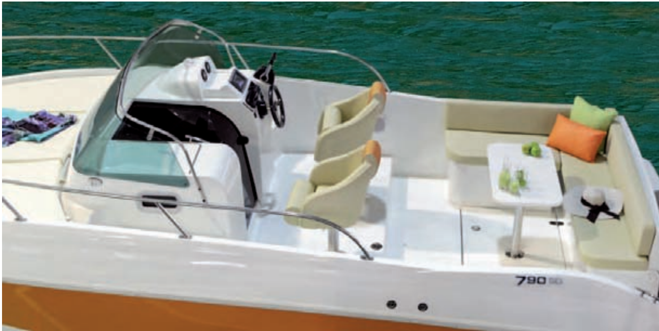
Vista de la cubierta de la versión standard con una amplia dinette, gran solarium a proa. View from the deck of the standard version with a big dinette and large sunbed at bow.