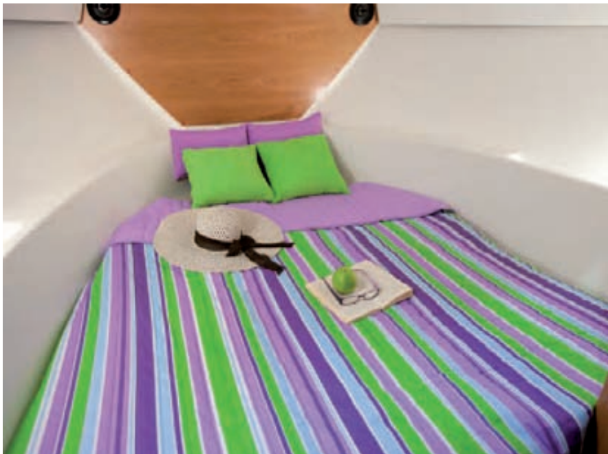
La dinette se transforma en una amplia cama doble (1,50x1,90 m) The dinette can be converted into a large double bed (1.50 x1.90 m)