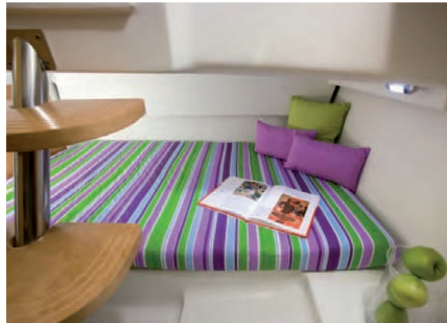
Camarote con cama doble (1,10x1,90 m) Cabin with double bed (1.10 x1.90 m)