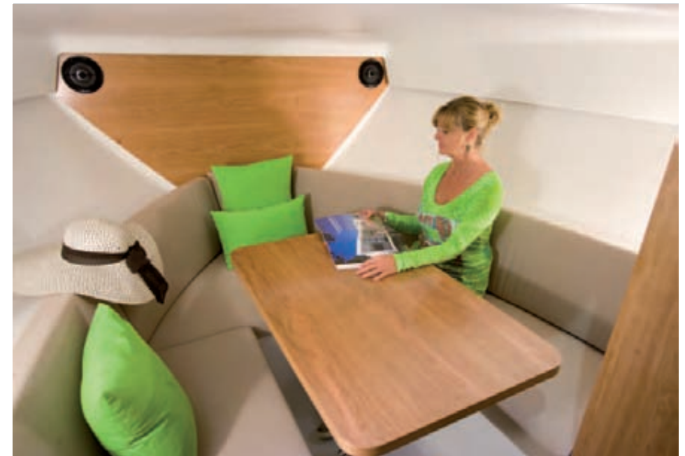
La lujosa dinette de proa dispone de mesa y armario ropero, ambos en madera de cerezo. The luxurious bow dinette is equipped with a table and wardrobe both in cherry wood.