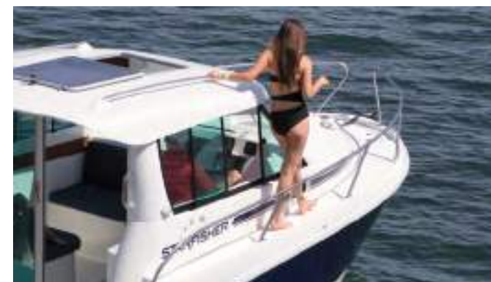
Cómodo pasó a proa. The generous sidedecks enables an easy access to the bow.