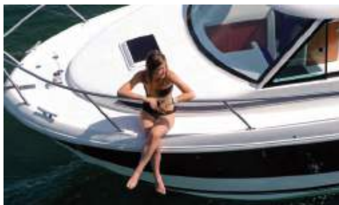
Proa amplia con pozo de anclas y solarium Wide sunbed at bow with spacious anchor locker.