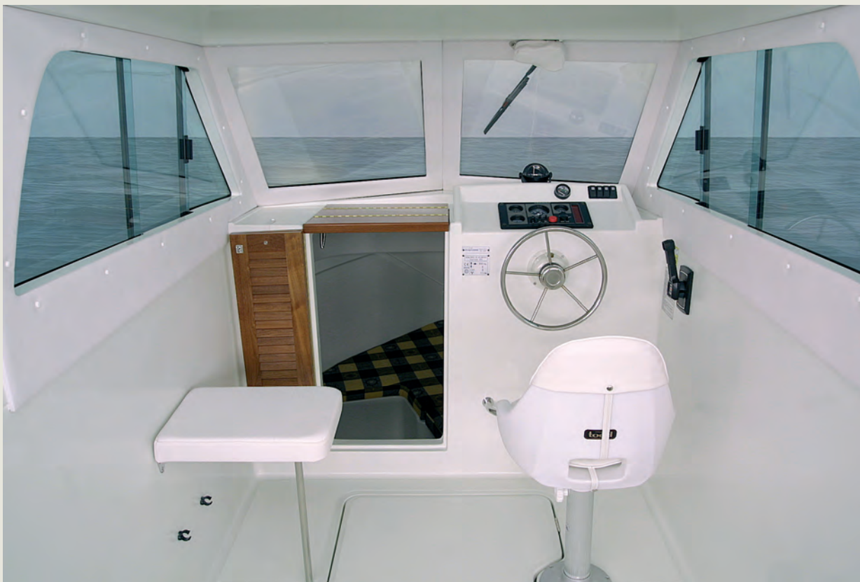
Cabina y puesto de gobierno con capó motor enrasado - Wheelhouse with integrated engine hatch.