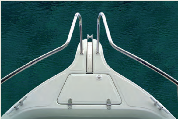
Botalón con roldana y herraje inox de protección - Bow platform with S/S sternhead fitting.