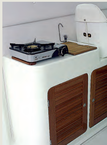
Bloque cocina opcional - Optional galley unit.