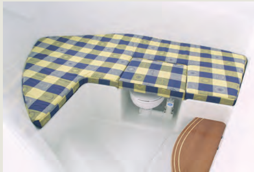
Cama lateral con asiento vestidor - Double berth to starboard with vanity seat in forward cabin

The concept of this attractive and economical fishing-cruiser is characteristic of that normally associated with larger boats.