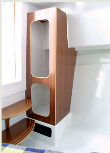
Armario perchero - Hanging locker.