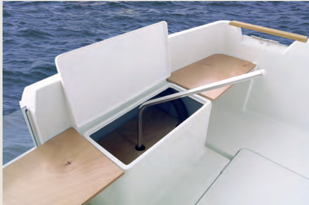
Caña de emergencia adaptable para la pesca al curricán - Emergency tiller adaptable as trolling tiller