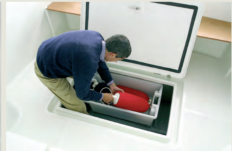
Amplio cofre central de estiba - Large central lazarette hatch.