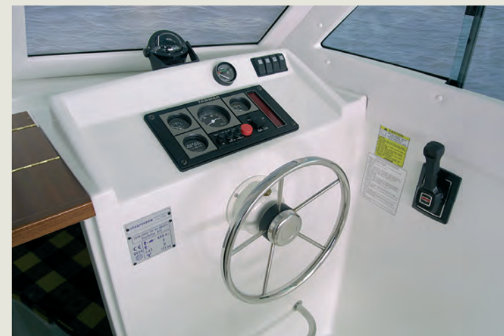
Consola con espacio que permite instalar electrónica empuñable - Large console for electronics.

Born of a new generation, the ST 670 is designed for comfortable sport fishing, offering the spaciousness of a bigger boat.