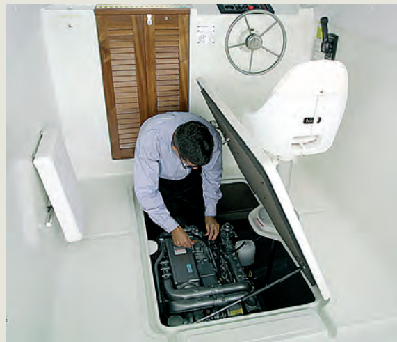
Cámara de máquinas de fácil acceso - Easy access to engine compartment.