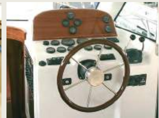
Puesto de gobierno Wheelhouse