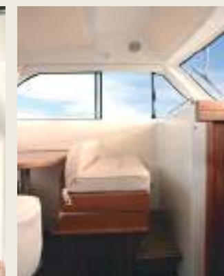
Doble asiento acompañantes a babor. Board side double seat.