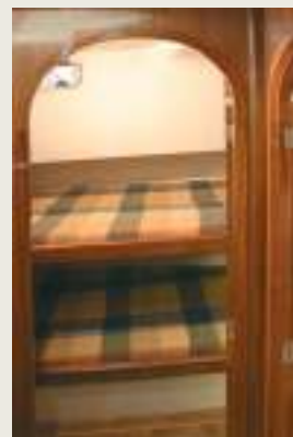
Camarote invitados Cabin for guests

The bathroom, comfortable and well illuminated, has a washbasin with mirror, shower, shelves for bathing products, WC and a porthole.