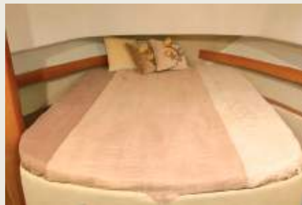
Camarote principal Main Cabin