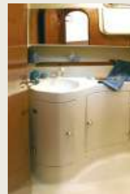
Cuarto de aseo Toilette